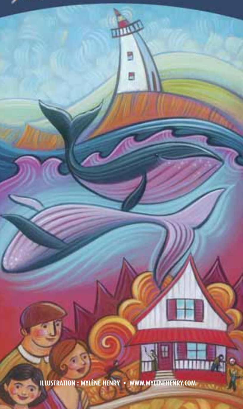
ILLUSTRATION : MYLÈNE HENRY • WWW.MYLENEHENRY.COM